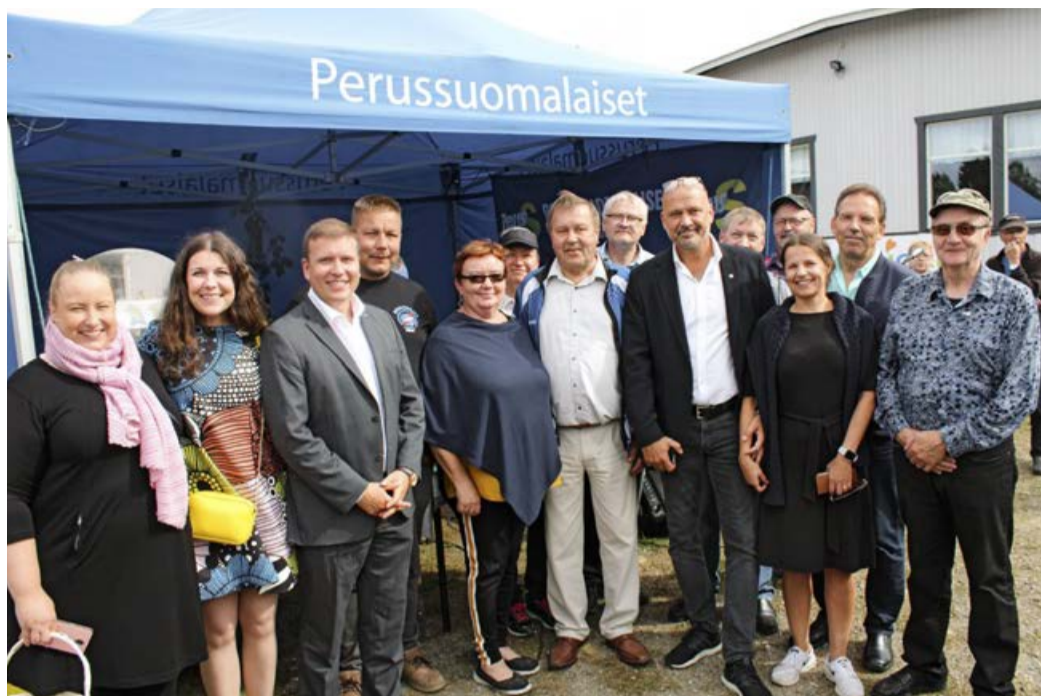
Kauhajoen kesämarkkinoilla perussuomalaisuus näkyi ja kuului.