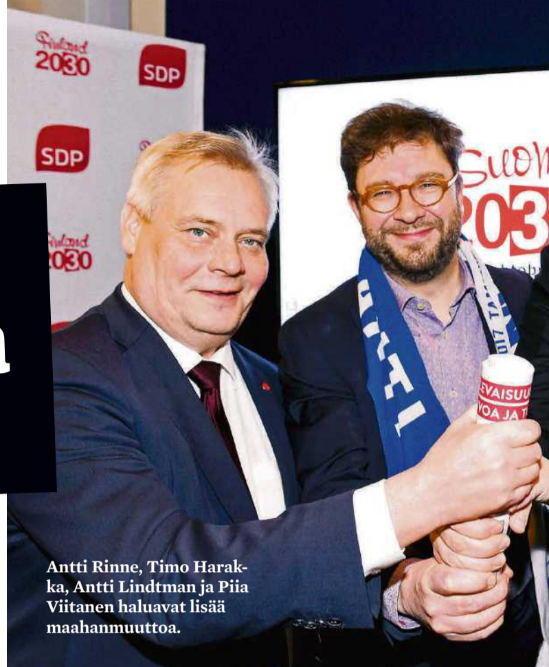
Antti Rinne, Timo Harakka, Antti Lindtman ja Piia Viitanen haluavat lisää maahanmuuttoa.

SDP:n salaisen muistion mukaan tämä uudistus ei edellyttäisi lakiuudistusta. Puolueen suunnitelmassa kuvioon astuisivat tässä vaiheessa erityiset valtioneuvoston selvitysmiehet: ”Riidanalaisten maasta poistamisten arviointi voidaan toteuttaa hallintomenettelylain tarkoittamana itseoikaisuna. Itseoikaisumenettely käynnistyy, jos valtioneuvoston selvitysmies havaitsee tähän olevan aiheita.”