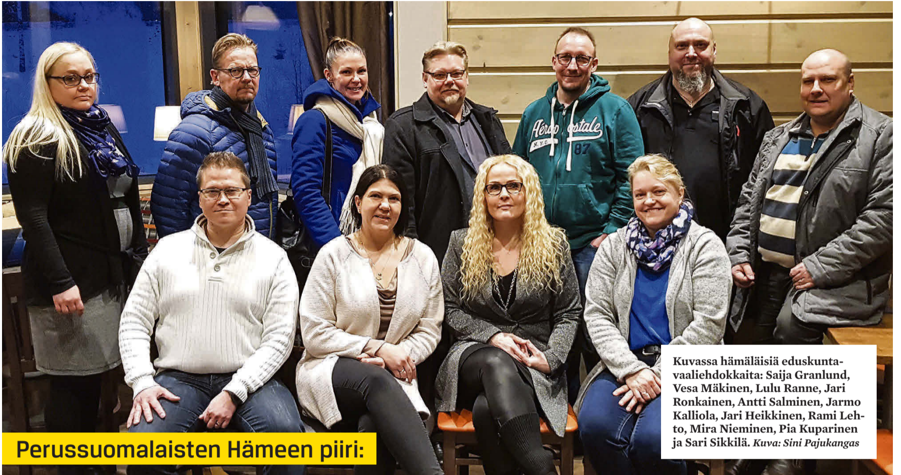
Perussuomalaisten Hämeen piiri: