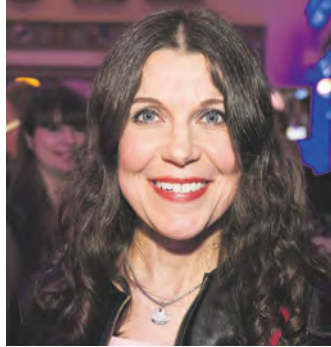
Espoon valtuustossa jatkava kansanedustaja Arja Juvenen kiitteli perussuomalaisia vaalitappiosta huolimatta Suomen parhaaksi toripuolueeksi.