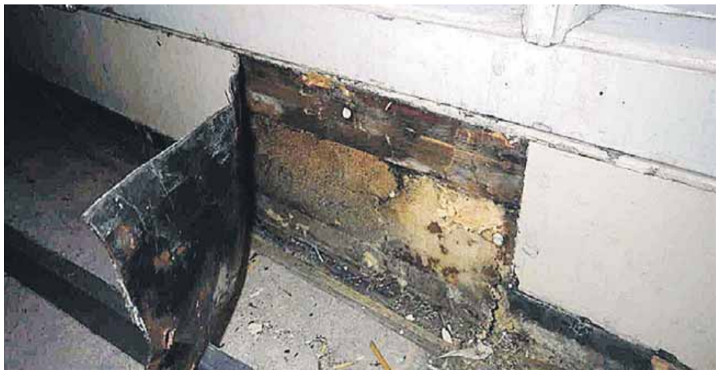
Sisäilmaraportin kuvamateriaalia. Ikkunaseinän rakenteessa merkkejä kosteudesta.

täkään ei voida vedenpitävästi todeta, johtuuko sairastuminen koulurakennuksesta.