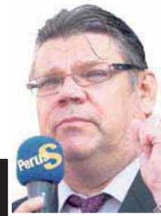
TIMO SOINI PERUSSUOMALAISTEN PUHEENJOHTAJA