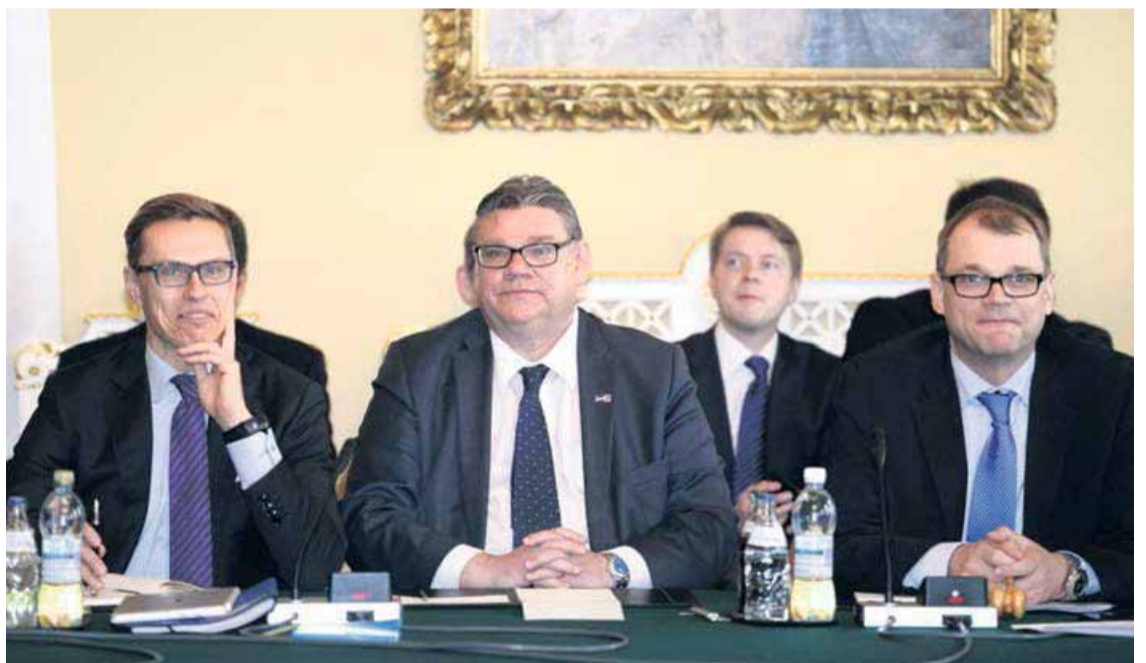
Puheenjohtajat Alexander Stubb (kok.), Timo Soini (ps.) ja Juha Sipilä (kesk.) ovat vääntäneet asioista kättä hyvässä hengessä.

Kehitysavusta löytyy odotettu linjaus, kun tarkkaan luetaan: