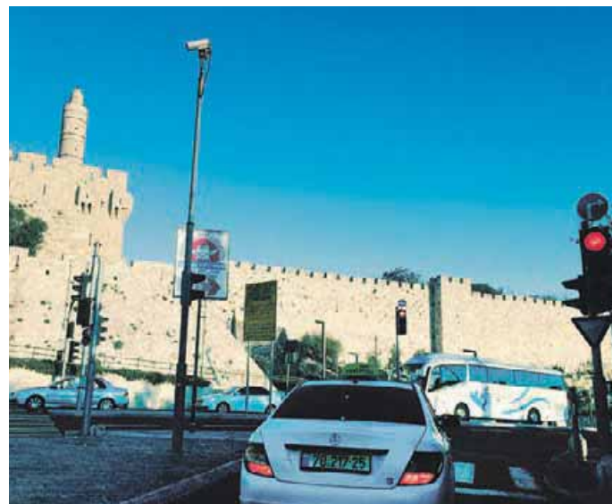
Jerusalem vanhankaupungin muurin sisäpuolelle ei ole terroriuhan vuoksi menemistä. Alueella on juutalaisten Temppelevuori ja Itkumuuri, kristittyjen Pyhän haudan kirkko ja muslimien Kalliomoskeija.