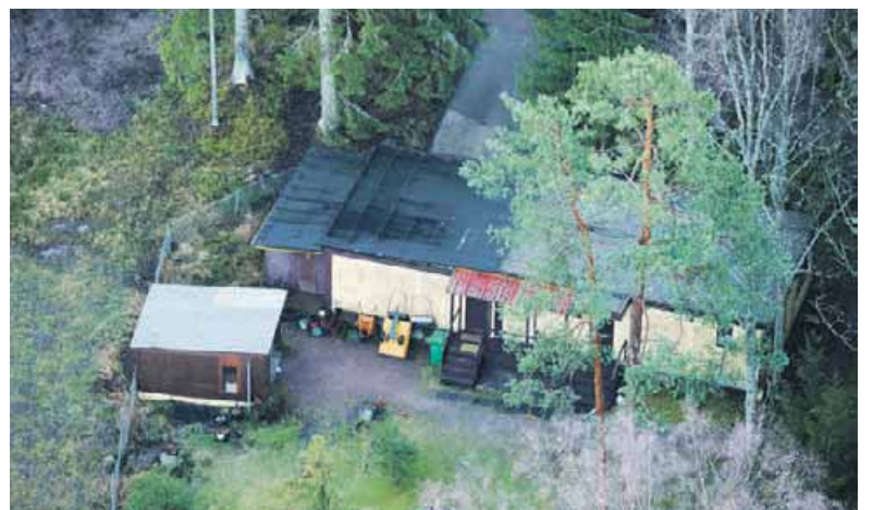
Tontin rakennukset ovat Venäjän suurlähetystön käytössä.