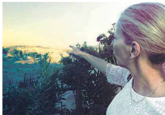
Israelin pinta-ala on vain 20 770 km 2 . Etäisyydet ovat lyhyitä. Taustalla näkyy Länsirannan eli West Bankin muuri.