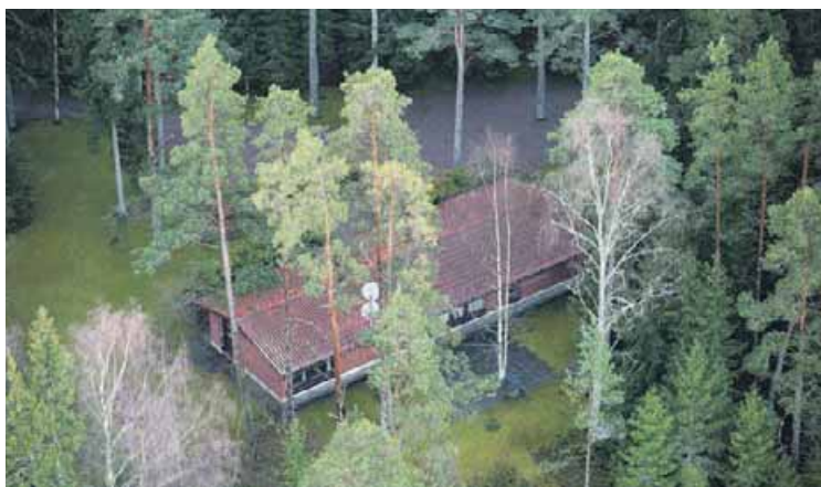
Kauempana rannasta on suurehko, pitkä tiilitalo, jota on vaikea havaita koska talo on katseilta suojassa korkeiden puiden takana.