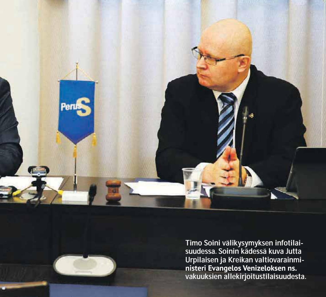
Timo Soini välikysymyksen infotilaisuudessa. Soinin kädessä kuva Jutta Urpilaisen ja Kreikan valtiovarainministeri Evangelos Venizeloksen ns. vakuuksien allekirjoitustilaisuudesta.